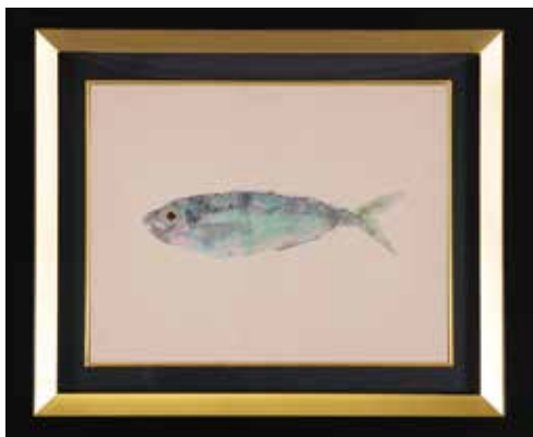
【追悼特別展示】第98代内閣総理大臣 安倍晋三「あじ」