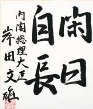
第100代内閣総理大臣 岸田文雄「閑日自閑」