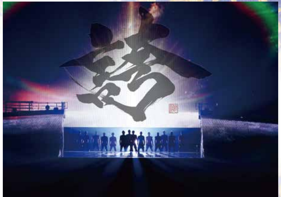
EXILE TAKAHIRO (歌手) 「詩」