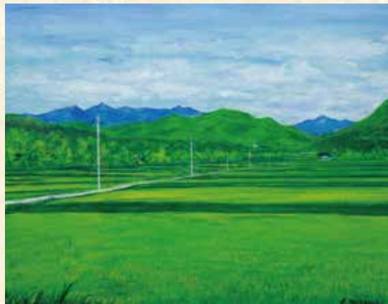
元宿 仁「ふる里の夏」50号F