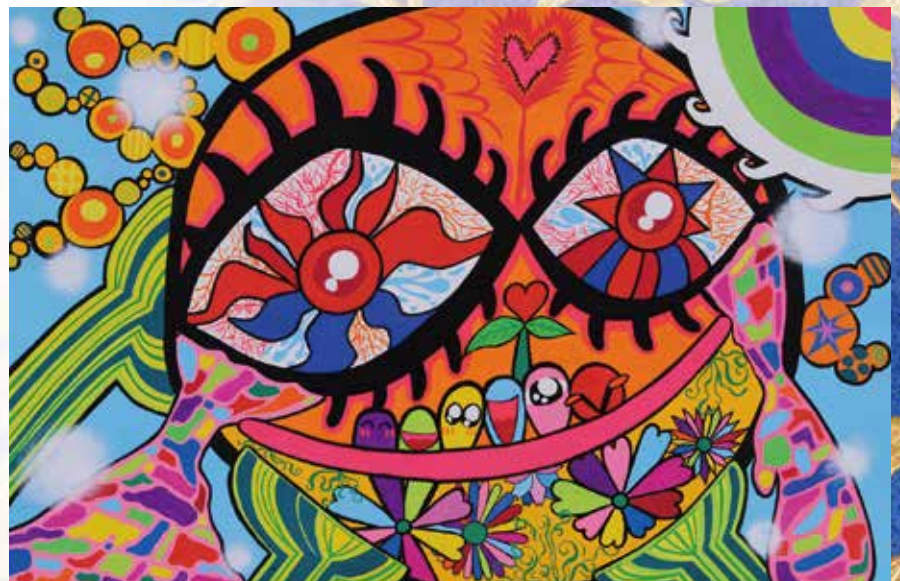
SKE48 北川愛乃 (アイドル) 「笑わなくても良いよ」

8月21日(日)9時30分より、 越谷アルファーズ 専属チアリーダー 「AlphaVenus」10名による オープニングイベントを メインロビーで開催致します。